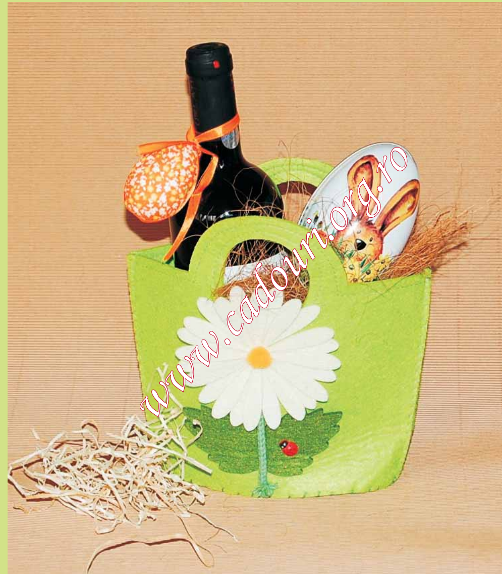
^ A7 - Cosulet din pasla cu ciupercute Vin rosu DOC Cabernet Sauvignon - 750ml Dealul Mare - Gama Romania Pitoreasca Nougat cu nuca - 100gr Turta dulce traditionala - figurina Iepuras Decoratiuni de primavara - ambalat in celofan